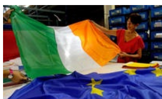
Evasione fiscale, in Irlanda si combatte così