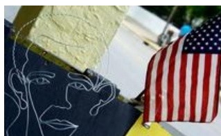
Evasione fiscale, in America si combatte così

È una rivoluzione silenziosa ma significativa. Infatti, l'evasione fiscale esce definitivamente dalla