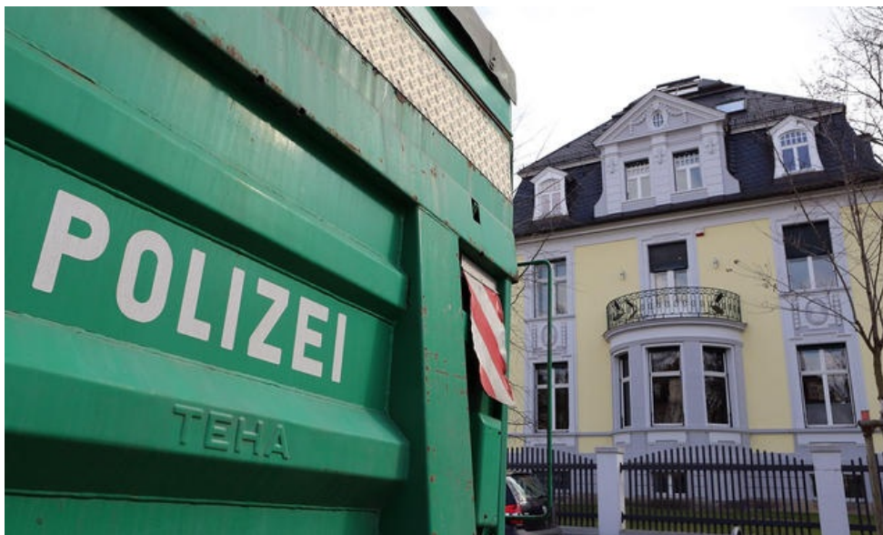
Polizia tedesca